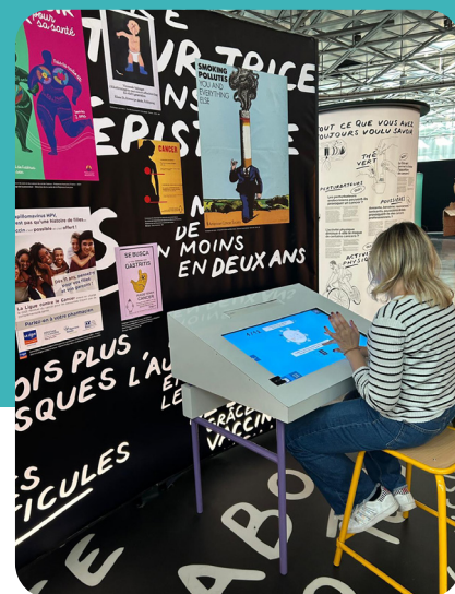
Visite de l'exposition «Cancers»

Les actions d'informations peuvent se faire de manière collective ou individuelle, via les Maisons De la Famille itinérantes, ou via des locaux mis à disposition par les communes. L'accès à ce dispositif est gratuit et anonyme pour les personnes qui souhaitent le solliciter.