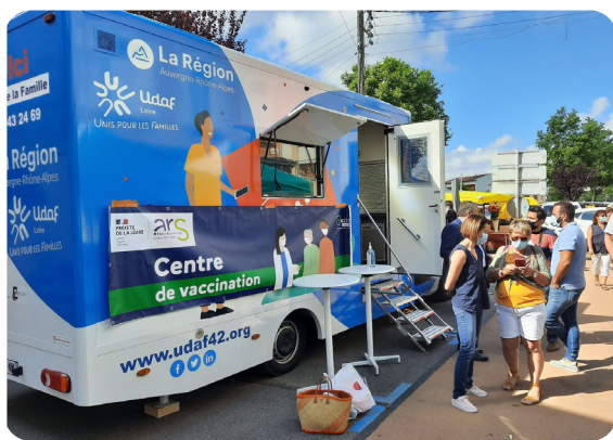
Campagne vaccinale 2021

Nous avons déployé des services de prévention santé dans nos Maisons De la Famille itinérantes et au côté de nos partenaires. Après l'accès au droit et l'aide aux démarches administratives, le « aller vers » continue, cette fois, en direction de la santé.